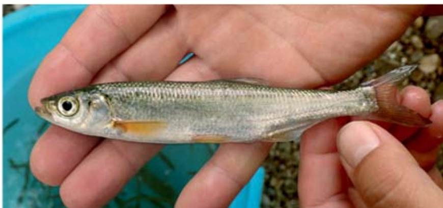
Slika 1: Pegunica Alburnus sarmaticus (Freyhoff in Kottelat, 2007).

Po podatkih mednarodnega rdečega seznama (IUCN) se je pegunica ohranila le v spodnjem toku Dnjepra in južnega Buga ter v porečju reke Do-