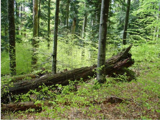
Pragozdni ostanki so biseri nedotaknjene narave znotraj obsežnih ohranjenih gozdov.

Natura 2000 je ekološko omrežje, ki se postopoma razvija v vseh državah Evropske unije. Vanj so vključena vsa območja, ki so pomembna za ohranjanje ogroženih rastlin, živali in njihovih življenjskih okolij.