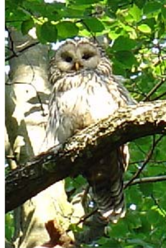
Najbolj pogosta sova v kočevskih gozdovih je kozača.