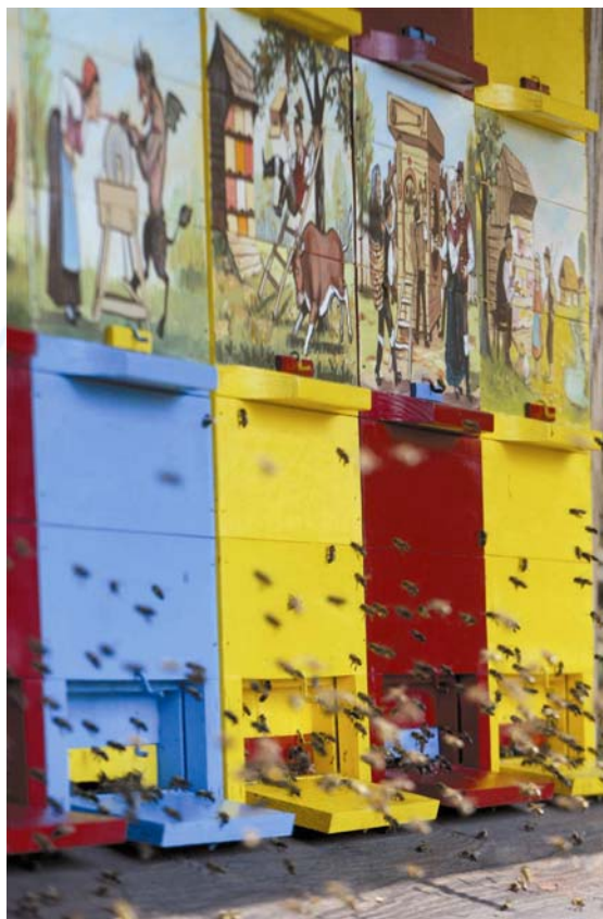
Bobo, STO Fototeka