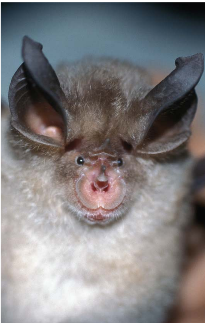
V Ajdovski jami se zadržuje kar 300 do 400 južnih podkovernjakov.

Glavni vzrok ogroženosti južnega podkovernjaka v Sloveniji je vznemirjanje kolonij v zatočiščih.