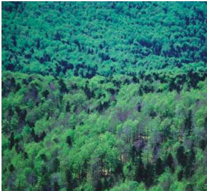
Jelovo - bukovi gozdovi so življenjski prostor mnogih živalskih vrst, tako drobnih hroščev kot velikih zveri.

Natura 2000 je ekološko omrežje, ki se postopoma razvija v vseh državah Evropske unije. Vanj so vključena vsa območja, ki so pomembna za ohranjanje ogroženih rastlin, živali in njihovih življenjskih okolij.