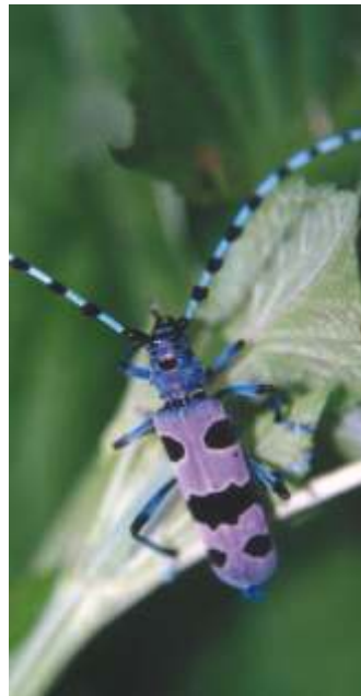
Hrošč alpski kozliček ima najraje sveže posekan bukov les, v katerega samice poleti odlagajo jajčeca.