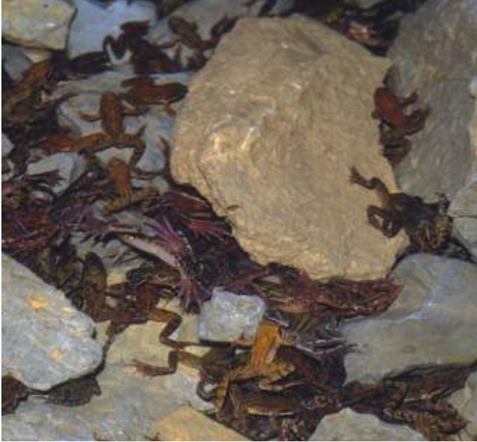
Vranja jama je prezimovališče velike kolonije žab sekulj.

Natura 2000 je ekološko omrežje, ki se postopoma razvija v vseh državah Evropske unije. Vanj so vključena vsa območja, ki so pomembna za ohranjanje ogroženih rastlin, živali in njihovih življenjskih okolij.