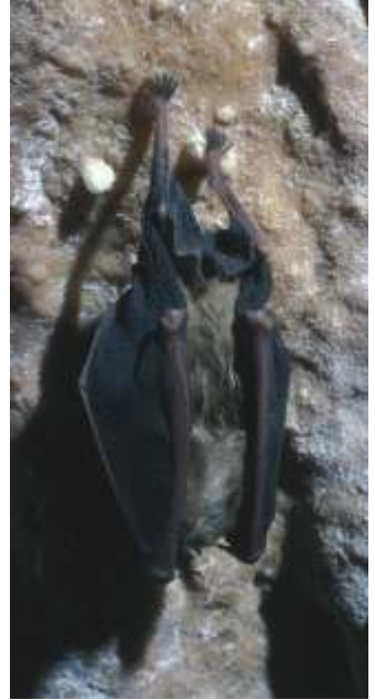
Netopirji so sesalci, ki prebijejo v jamah pomemben del svojega življenja.