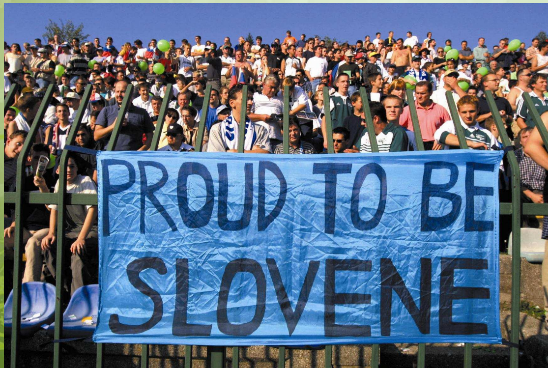
Bobo, Fototeka STO